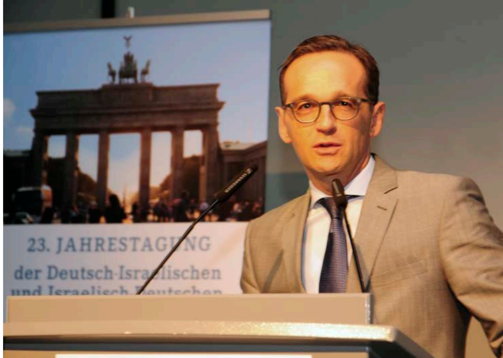
Zur Eröffnung der 23. Jahrestagung in Berlin sprach der Bundesminister der Justiz und für Verbraucherschutz Heiko Maas.

Antisemitismus und auch mit der Geschichte der Justiz. Es ist jetzt 70 Jahre her, dass die Nazis mit ihren „Nürnberger Rassegesetzen“ Juden zu Menschen zweiter Klasse gemacht haben. Leider ist ausgerechnet dieses Gesetz ein beschämendes Beispiel für die Kontinuität zwischen Nazi- und Nachkriegsdeutschland.