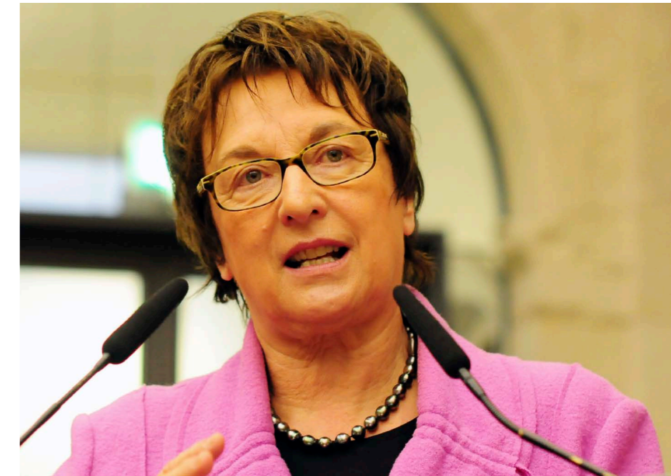
DIJV-Präsidentin Brigitte Zypries, Bundesministerin der Justiz a.D., MdB

In der Deutsch-Israelischen Juristenvereinigung sprechen nicht Regierungen miteinander, sondern Kollegen. In vielen Fällen auch Freunde. Wenn sich deutsche und israelische Juristen bei unseren Jahrestagungen treffen, ist die Vergangenheit immer mit im Raum – aber sie steht nicht immer im Vorder-