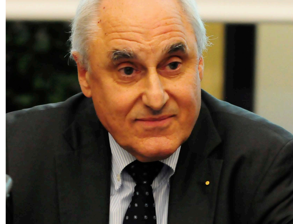
Zugang zum Recht und die Rolle der Anwaltschaft: Ekkehart Schäfer, Präsident Bundesrechtsanwaltskammer

Um nicht missverstanden zu werden: Die Ermöglichung des Zugangs zum Recht ist eine genuin staatliche Aufgabe. Und das bedeutet u. a., dass der Staat ihn auch für diejenigen garantieren muss, die sich einen Rechtsanwalt nicht leisten können. Den Zugang zum Recht muss auch der sozial schwache Bürger haben. Er darf nicht vom Geldbeutel abhängig sein. Jeder muss sich auf Augenhöhe mit seinem Kontrahenten messen können. Eine Zweiklassengesellschaft vor Justitia darf es nicht geben, auch und insbesondere nicht im Strafrecht.